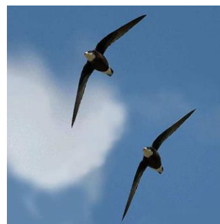
図：（右上）ハリオアマツバメ。（左）世界で初めて解明されたハリオアマツバメの渡り経路の一例。北海道で繁殖した個体が、オーストラリア東部で冬をすごしていることが明らかになった。その春と秋の渡り経路は、東アジア・オセアニアに大きく「8の字」を描く非常に特殊なものであることが分かった。