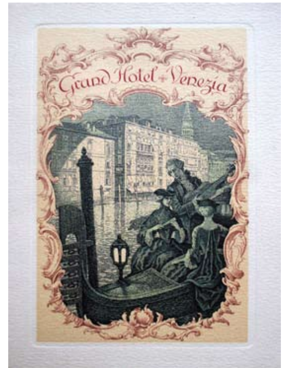
Fig. 4: Copertina del dépliant stampato dalla Richter & C. per il Grand Hotel di Venezia, composto da 12 pagine, 18.8 x 24.8 cm, 1930 ca., 17.0 x 11.8 cm, collezione privata.

di Camillo Napoleone Sasso, Storia dei Monumenti di Napoli , corredato di ricchi disegni architettonici dei principali monumenti napoletani. Nel 1860 pubblicò un album di caricature in 24 tavole, disegnate da Melchiorre Delfico (1825-1895) e la celebre stampa a cromolitografia raffigurante il Duomo di Monreale presso Palermo. Per quest'ultima opera l'officina Richter fu premiata in occasione dell'Esposizione nazionale tenuta a Firenze nel 1861 [ Esposizione italiana 1865 , p. 250]. Nel 1886 stampò il grande volume di mm 630 x 445 intitolato Dipinti murali di Pompei. Medaglie Istituto d'Incoraggiamento di Napoli Esposizioni di Londra e Milano , una raccolta di venti cromolitografie raffiguranti gli affreschi murali di Pompei, eseguiti dall'architetto Edoardo Cerillo e dall'incisore Vincenzo Loria (1850-1939).