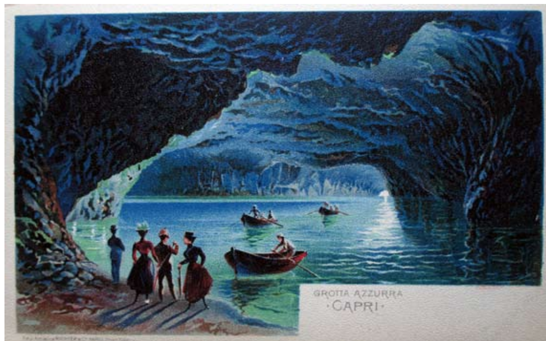
Fig. 1: Cartolina raffigurante la Grotta Azzurra di Capri, in cromolitografia dell'edizione artistica proprietà riservata, Richter & C., Napoli, 1900 ca., 14.0 x 8.9 cm, collezione privata.

La ditta Richter fu fondata a Napoli ufficialmente nel 1842 dal litografo Cristiano Richter [Giornale del Regno delle due Sicilie 1842, p. 715], "importando le più recenti pratiche della Svizzera e della Germania" [Atti del Reale Istituto... 1877, p. 17]. Le sue attività risalivano agli anni trenta dell'Ottocento. Difatti, la Biblioteca Nazionale di Napoli conserva una litografia, intitolata Stato