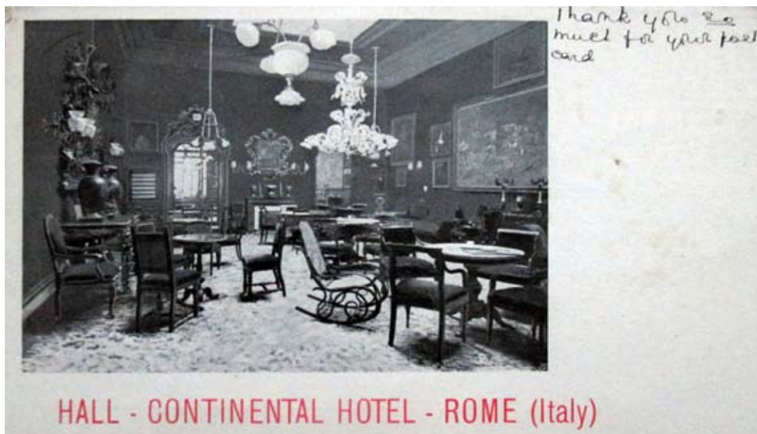
Fig. 7: Cartolina pubblicitaria dell'Hotel Continental di Roma, raffigurante la fotografia della hall stampata dalla Richter & C., 1910 ca., 14.0 x 9.0 cm [collezione privata].