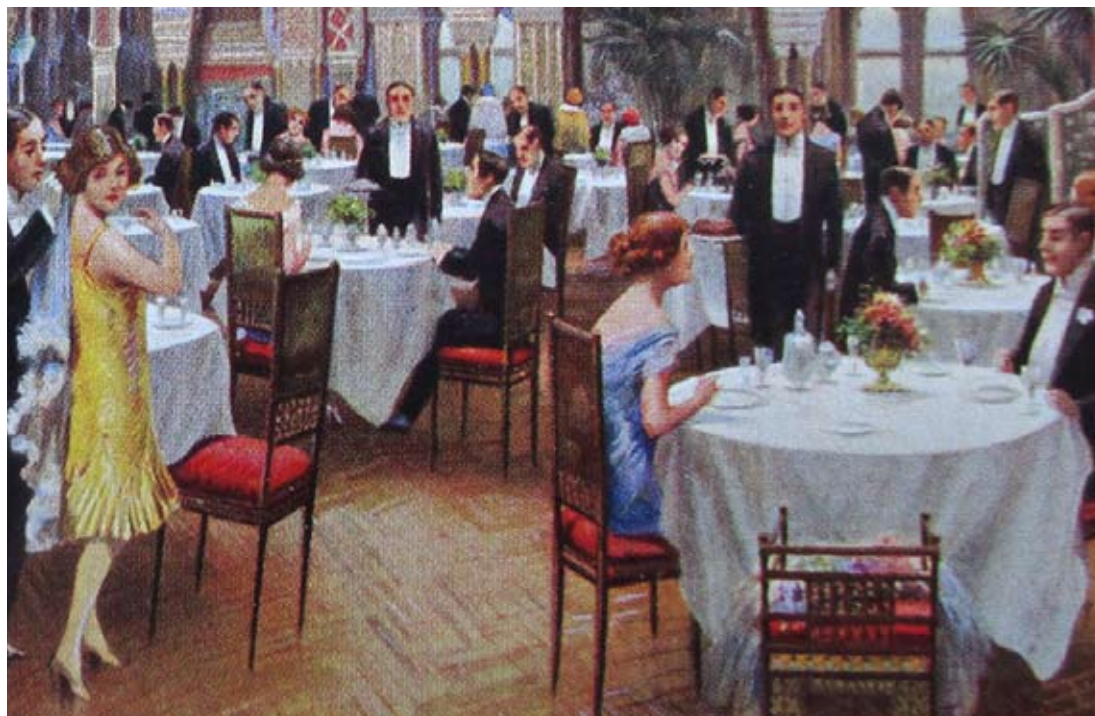
Fig. 9: Particolare della cartolina promozionale dell'Hotel Royal di Roma, raffigurante l'interno del salone del ristorante, firmata 3B (in basso a destra), stampata dalla Richter & C., 1920 ca., 14.0 x 9.0 cm, collezione privata.