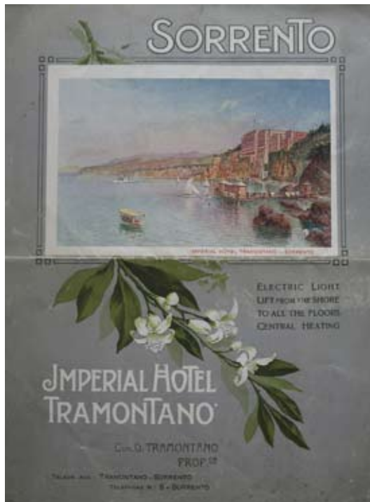
Fig. 3: Copertina del dépliant stampato dalla Richter & C. per l'Imperial Hotel Tramontano di Sorrento, composto da 4 pagine; la veduta prospettica dell'albergo è identica a quella riprodotta in una cartolina, 18.8 x 24.8 cm, 1910 ca., 14.0 x 8.9 cm, collezione privata.