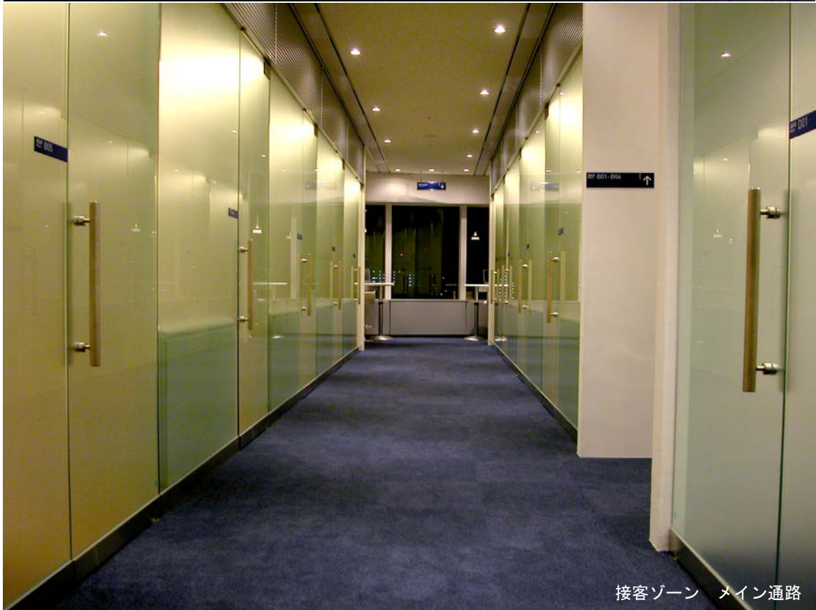
接客ゾーン メイン通路