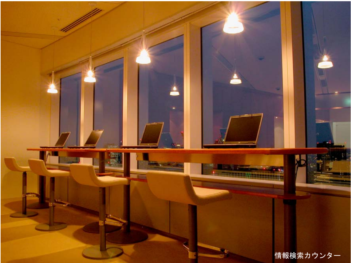
情報検索カウンター