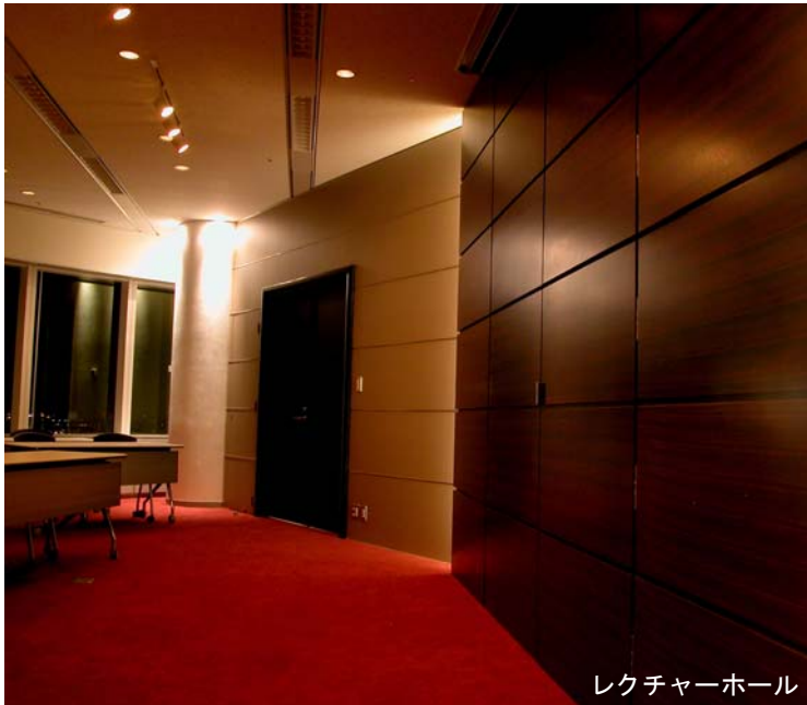
レクチャーホール