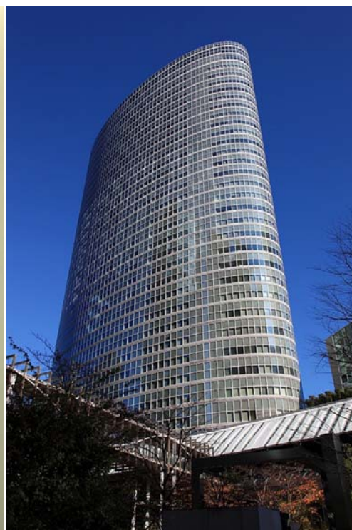
品川インターシティ外観(日本設計)