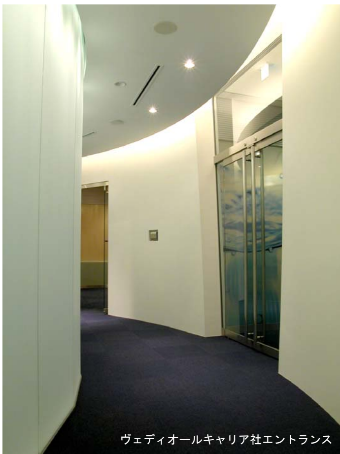
ヴェディオールキャリア社エントランス

S造地上32階建ての30階部分, 延床面積1,100㎡, 事務所, 東京都港区, 岡松道雄(基本計画・基本設計・実施設計・工事監理および家具・照明デザイン), 木下順雄(家具デザイン・工事監理)