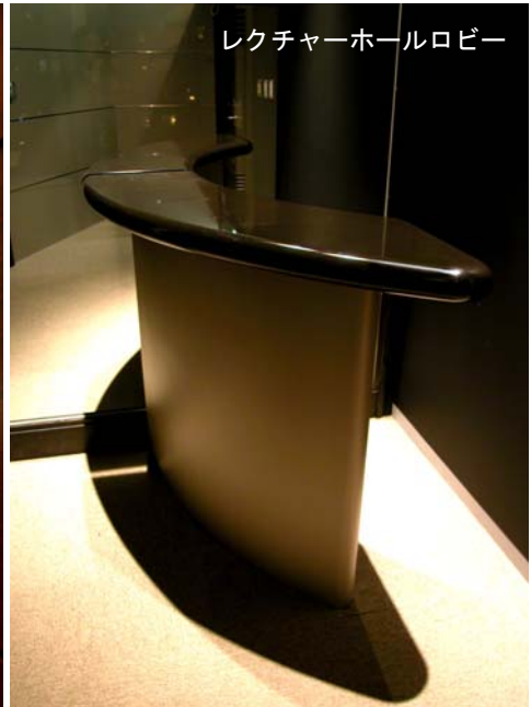
レクチャーホールロビー