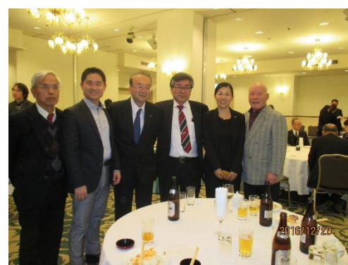
薬理学研究室忘年会にて 12/20/2016