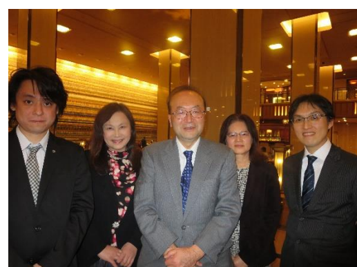
平成27年度コミュニケーション教育学会合同研究会(産業連合研究会)3/6/2016 於:日本医療大学