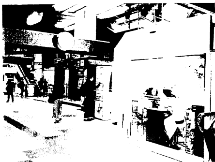
図4 BTSの構内にある店舗