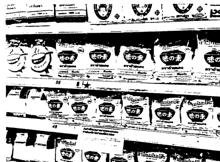
図6 スーパーに陳列される味の素商品

突然だが、タイ料理はお好きだろうか。チリの辛み、ライムの酸味、ココナッツミルクの甘み、ナンプラーの塩味。そして、レモンガラス、パクチーなどの香りがタイ料理の特徴だとされている。そんなタイ料理だが、実は、日本のあるものがないと成立しない。それは、「味の素」である（図6）。これがないとタイ料理とはいえない。「味の素」がタイに進出した歴史はかなり古い。1960年に合弁会社ができただけで、すでに60年近い。このあいだ、「味の素」は戦略的にマーケティング/ブランディングを行ってきた。バンコクのお