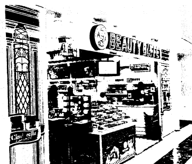
図1 化粧品のセレクトショップ

一方タイは、化粧品市場規模は663億3,700万バーツと推定されている。スキンケア市場は507億バーツ、メイクアップ市場は157億バーツであったとされる。化粧品市場に占めるスキンケア商品の割合はおよそ76%、メイクアップ商品の割合はおよそ23%、男性化粧品市場は48億バーツであり、スキンケア、シェービング、デオドラントなどで市場が拡大したとされている。タイは日本から1,190トンの化粧品を輸入しており、そのシェアは17.0%と、アメリカに次いで第2位であった。しかし、その輸入はおそらく低下している。その理由は、後述したい。