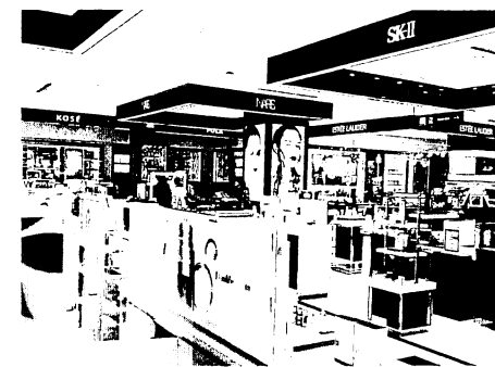
図2 百貨店の化粧品コーナー

なお、タイにおける化粧品の価格帯であるが、一般的にカウンターブランドと呼ばれる高価格帯のプレミアムブランド化粧品は、主にSiam Paragonのような百貨店などを販路とし、日本の化粧品であればSHISEIDO, IPSA, KATE Tokyo, SK-II, THREEなどが扱われている（図2）。その価格は1,000バーツを超え、20,000バーツを超えるものもある。BootsやWatsonsなどのようなドラッグストアで販売されているマズブランドの日本の化粧品であれば、Hada Labo, MAJOLICA MAJORICA, AQUA LABELなどがある。その価格帯は、100バーツ前後から1,000バーツ前後である。ほかにも、サイアムスクエアをはじめとする繁華街などにある露店（図3）、BTS（高架鉄道）の構内で展開するKarmartsなどの独立系店舗（図4）、セブンイレブンをはじめとするコンビニエンスストアでも、