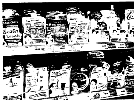
図5 コンビニに並ぶ使い切り化粧品

それによると、タイ人か日本人かにかかわらず、多くの化粧行動で男女差があることが明らかになっている。男女差がない化粧行動は、タイ人で