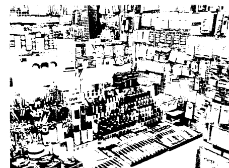
図3 露店での化粧品販売