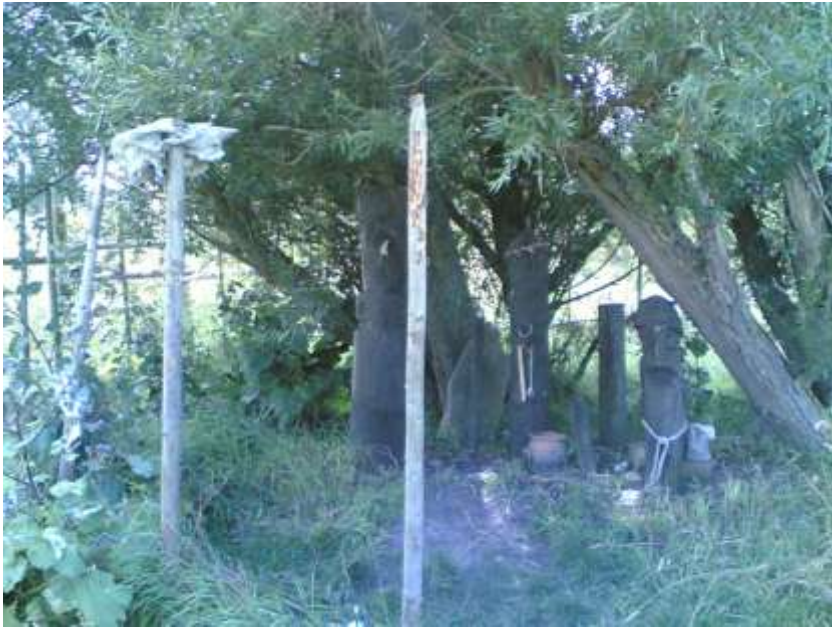
(上)野外にしつらえた「聖域」再現 (フォテヴィク野外博物館／スウェーデン)