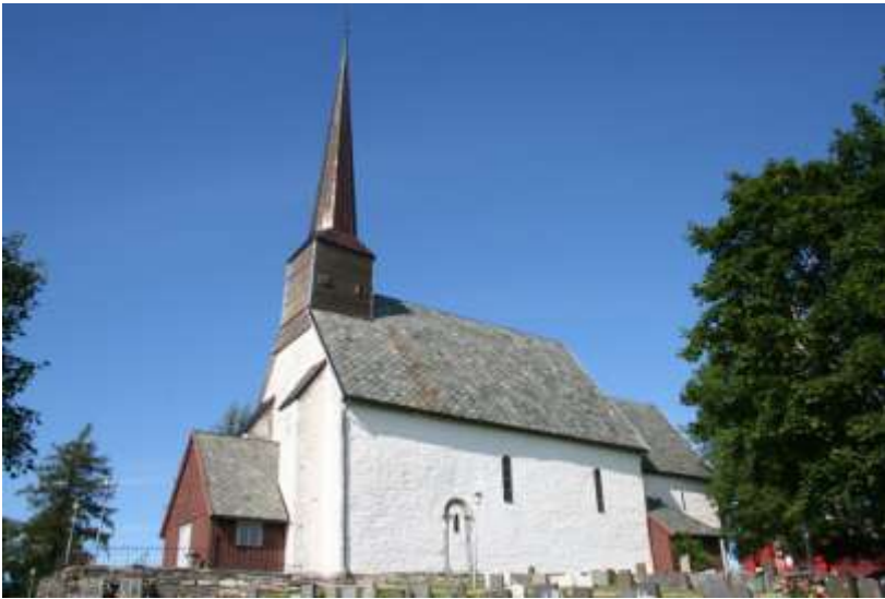
現存するメーレ教会(12世紀後半建造)