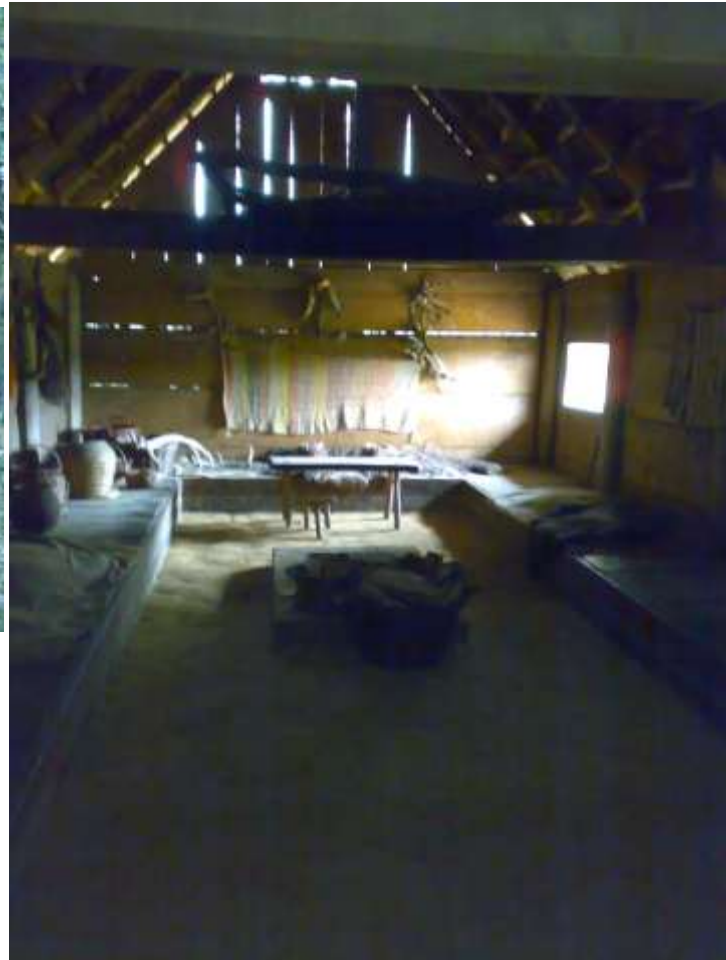
(右)首長(有力者)の館の再現建築 (リーベ・ヴァイキング博物館／デンマーク)