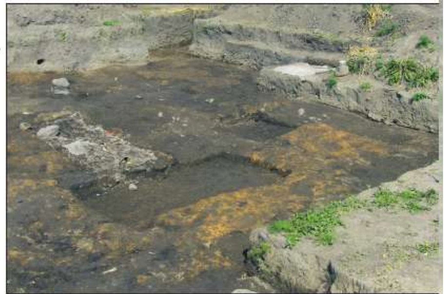
Av eld rödfärgad vägg.