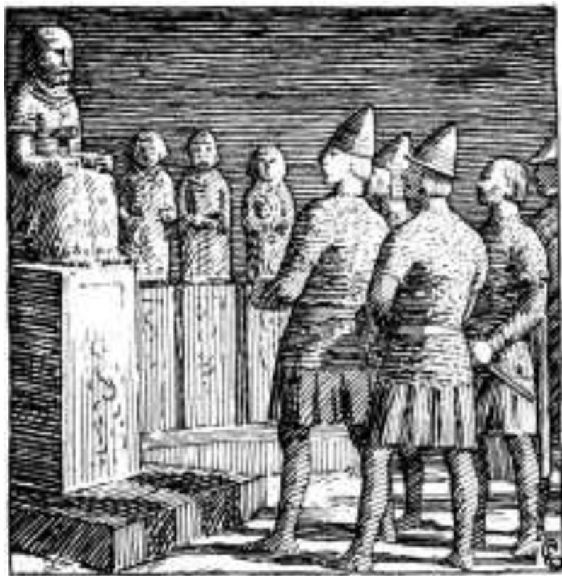
ソール(トール)の聖域に入る王OT(19世紀の画家H. Egidiusの再現画)