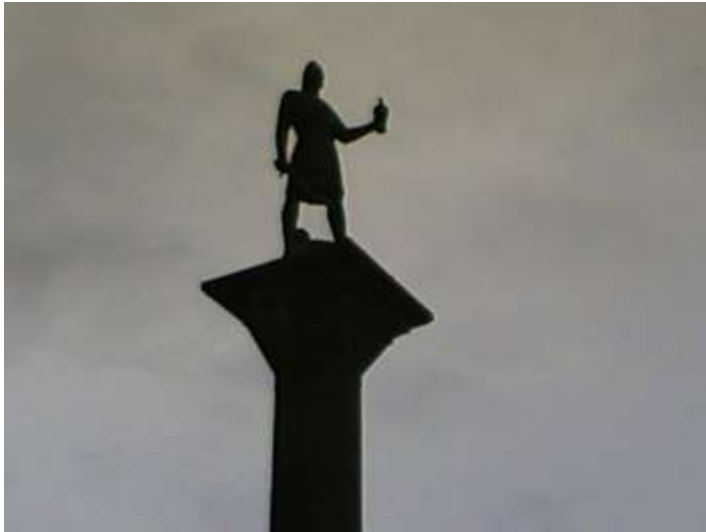
オーラヴ・トリュグヴァソン