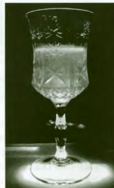
写真2 ラインカクテール 前田のオリジナルカクテル。この時代のカクテルの特徴として、フレッシュジュースは使わず、酒のみを使用したアルコール度数の高いカクテルとなっている。