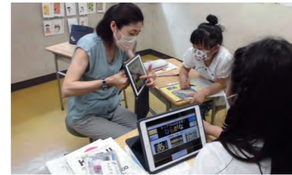
ICTを活用した初期指導

夏休み国際読書会は、多言語での本の読み聞かせ会で、子どもたちに人気のイベントです。南区多文化共生事業を活用し、みなみラウンジや韓国総合教育院が