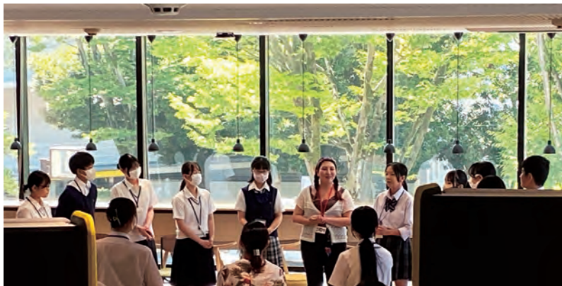
ユースミーティング

ユネスコスクールに期待される 取り組みの「3つの柱」とは、 現場の教育にとって具体的に どのような活動をいうのでしょうか？ それぞれの学校で、 3つの柱をバランスよく教育活動の 中に反映させるためには どんな取り組みができるでしょうか？ 本大会では、ASPUnivNetや 「かながわユネスコスクールネットワーク (KAN)」 からの推薦を受けた グッドプラクティスの実践から学び、 参加者同士で意見を 交換し合う機会をもうけました。