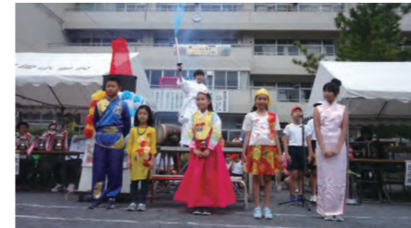
運動会のトーチリレー