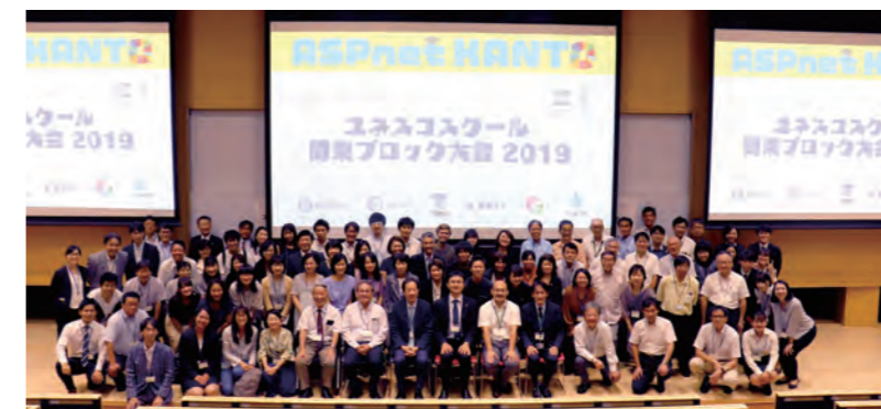
「第 1 回ユネスコスクール関東ブロック大会」は 2019 年に玉川大学で開催されました。

日時: 2024 年 (令和 6 年) 10 月 5 日 (土) 10:00 ~ 17:00 主催: 玉川大学教育学部 共催 (予定): 東海大学 / 創価大学 / 成蹊大学 / 次世代ユネスコ国内委員会 / ASPUnivNet 会場: 玉川大学 大学教育棟 2014 5 階教室 (対面を主とし部分的にハイブリッド形式) 後援 (予定): 日本ユネスコ国内委員会 / 日本ユネスコ協会連盟