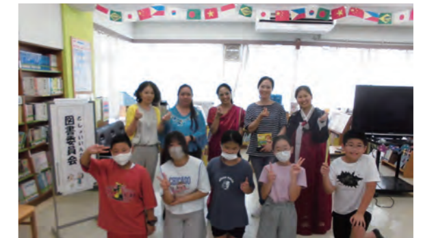
夏休み国際読書会