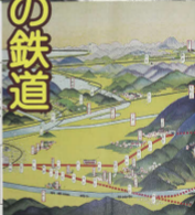
(左) 大阪鉄道合併制度成立(部分) 有田清成氏画 (左下) 木軸カレンダー 新線開通号(部分) 有田清成氏画