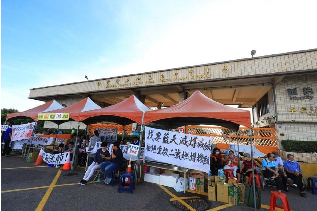
写真3 台中火力發電所に向けた座り込みデモ活動