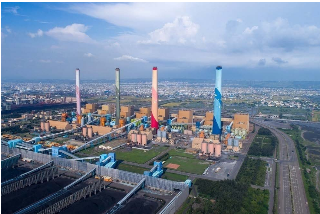
写真2 台湾最大の石炭火力発電所——台中火力発電所