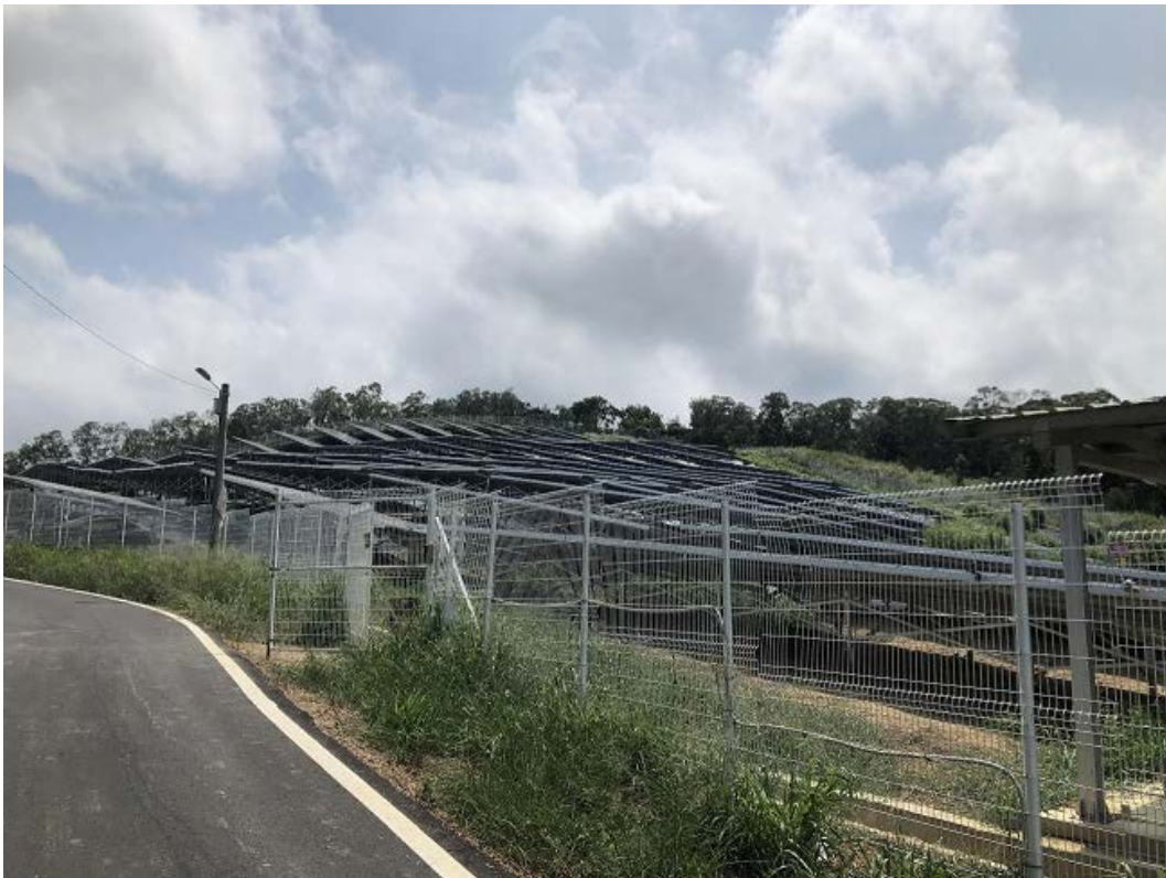
写真1 苗栗県通霄鎮に位置する「小光電」