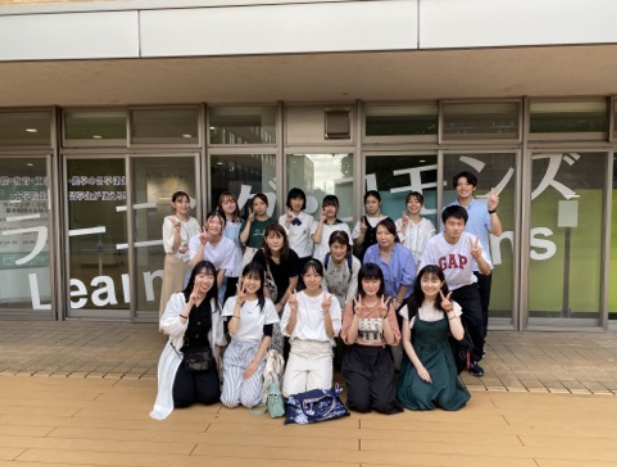
2022年夏の交流会の様子はこちらをご参照ください。 https://www.utsunomiya-u.ac.jp/topics/education/009974.php

いま現在も起きている武力紛争。紛争下にある子どもたちの生活について一緒に考えてみませんか？