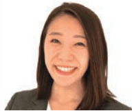
くろす なるみ 黒須 成美氏

マラソンランナー／ スポーツコメンテーター 1996年アトランタオリンピック 10000m 5位