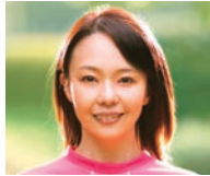
ちば まさこ 千葉 真子氏

マラソンランナー／ スポーツコメンテーター 1996年アトランタオリンピック 10000m 5位