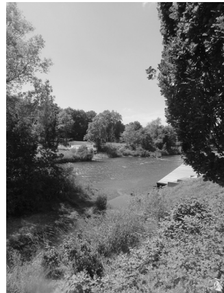
Plettenberg (14. Juli 2022)

Geboren bin ich 1940 im Krieg, mein Vater ist 1943 in Russland gefallen. Aufgewachsen bin ich in einem alten Haus am Hang des Berges Saley mit großem Garten und eigenem Wald. Als Gymnasiast habe ich mich begeistert für Preußen und die Hauptstadt Berlin. Interessiert war ich früh an Natur, Heimatkunde, naturwissenschaftlichen Experimenten, vor