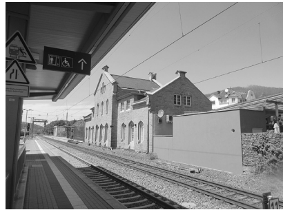
Bahnhof Plettenberg (14. Juli 2022)

Giesler : Plettenberg im Sauerland, von „schlafenden“ Bergen umgeben (Zitat Konrad Weiß), ist eine Provinzstadt mit ca. 24.000 Einwohnern. An der Eisenbahnstrecke zwischen Siegen und Hagen gelegen, mit starker klein- und mittelständiger Industrie. Es gab eine Dominanz des Protestantismus, z. Zt. Carl Schmitts waren im Kaiserreich Katholiken in der Diaspora, nach dem II. Weltkrieg änderte sich das durch Flüchtlinge.