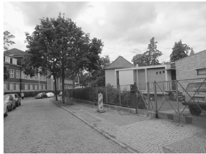
Kaiserswerther Straße in Berlin-Dahlem (10. Juli 2022)