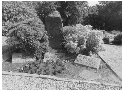
Das Grabmal Carl Schmitts im katholischen Friedhof Plettenbergs (14. Juli 2022)