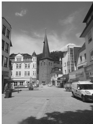
Eine evangelische Kirche im Stadtzentrum Plettenbergs (14. Juli 2022)

Giesler : 1969 war ich Redakteur in der führenden chemischen Fachzeitschrift „Angewandte Chemie“, dann Lektor im Verlag VCH für Bücher: Monographien, Lehrbücher für Chemie, bald auch für Biologie, Physik u. a. Ein Schwerpunkt bildete dabei die Geschichte der Chemie und weiterer Naturwissenschaften, dazu gab es eine eigene Buchreihe mit den Direktoren des Deutschen Museums München. 1983 folgte dann die Gründung der Sparte Acta humaniora für Werke