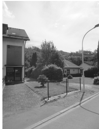
Plettenberg-Pasel (14. Juli 2022)