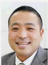
いりさわ たくや 入澤 拓也 様

電子技術総合研究所、産業技術総合研究所、公立はこだて未来大学、東京大学を経て現職 主要編著書にAI白書(2017)、人工知能とは(2016)、知能の物語(2015)など