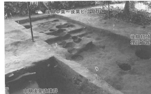
図2 C区完掘状況 (北西から)