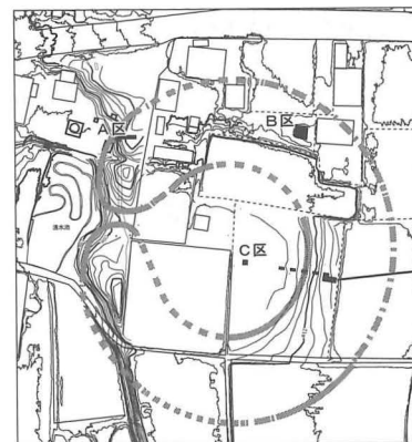
図1 調査区位置図 (S=1:3000)

②瘤付系注口土器：下半部のみのため壺の可能性もあるが、胴部最大径部分の4か所に貼瘤を配し、それらを磨消縄文帯で連結する瘤付土器系である。市内の後藤遺跡や藤岡神社遺跡でも瘤付系の注口土器が出土している。この土器が出土したP7は複数の小形ピットに切られているため、2019年度はおおよそのプラン