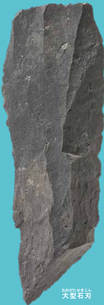
おおがたせきじん 大型石刃