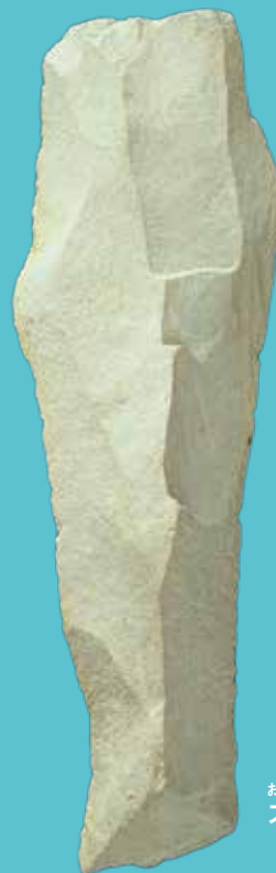
おおがたせきじん 大型石刃