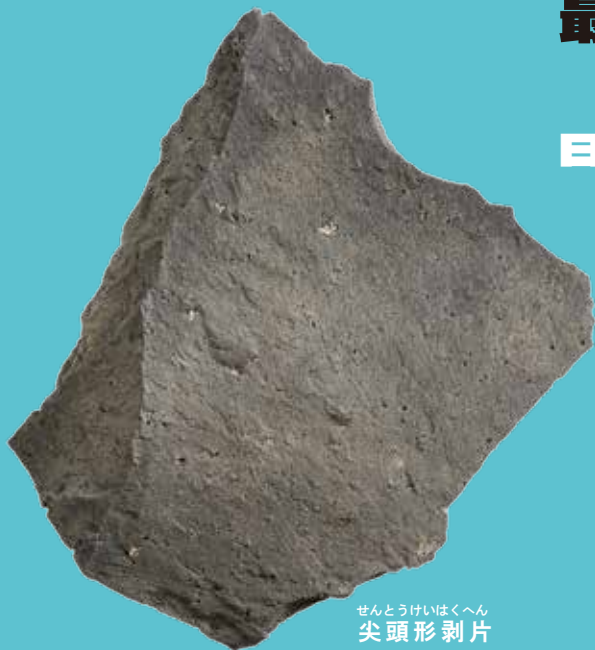
せんとうけいはくへん 尖頭形剥片