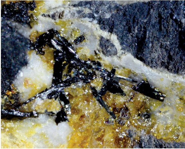
写真 1 ランタンバナジウム褐簾石の実体顕微鏡写真(写真横幅 1 mm) 黒色長柱状の結晶として産する。