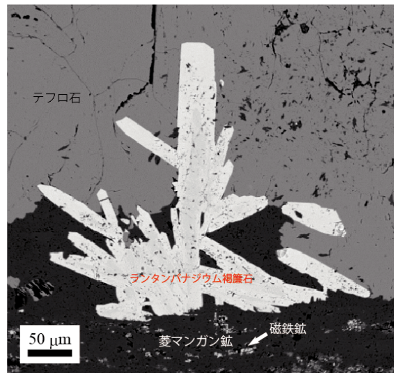
写真 2 ランタンバナジウム褐簾石の顕微鏡写真(左)と後方散乱電子像(右)。ランタンバナジウム褐簾石は肉眼的には褐色の結晶で、重たい元素であるバナジウムとランタンを含むため後方散乱電子像では明るく撮影される。

いわゆる褐簾石は緑簾石グループの一種であり複雑な結晶構造をしています。緑簾石族鉱物はレアアースのリザーバーとして非常に高い能力をもつ鉱物です。褐簾石の結晶構造には元素が存在する席が複数有り、それぞれの席にどの元素が存在するのかを決めるのは非常に難しいのですが、今回発見したランタンバナジウム褐簾石ではランタンが A2 席に、バナジウムが M1 席に存在することを明らかにすることができました。ランタンとバナジウムの組み合わせが緑簾石グループに存在することを証明した例は本研究が世界初であり、この褐簾石は新種の鉱物として承認されました。今回発見されたランタンバナジウム褐簾石に含まれるレアアースはランタンが最も多いですが、セリウム、プラセオジウム、ネオジウムなども同時に含まれています。