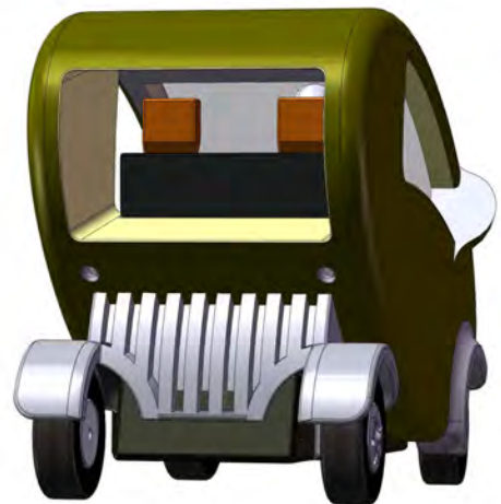
●リア・ビュー：人力車のイメージ… 和服でも乗れる車