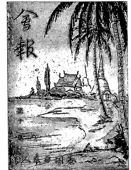
泰国日本人会会報第11号 (1941年3月20日発行)

ならば、それに依拠して比較的容易に書くことができるはずである。ところが、日本人会には、この種の文書は何ら残されていない。また、1930年代前後の日本人会は1~2年に一回の割で、合計10数号の会報を発刊しているが、公共施設や個人の所蔵として、保存されていることを筆者が確認できたものは、7号(1936年7月15日発行、ガリ版刷)、8号(1937年5月1日発行、神戸で印刷)、9号「アンコール特輯号」(1938年3月1日発行、神戸で印刷)、10号(1939年9月30日発行、神戸で印刷)、11号(1941年3月20日発行、神戸で印刷)の5冊に過ぎない。