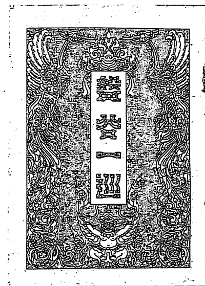
日本人会の初期出版物、 三木栄著『盤谷一巡』(1921年)

「サツパトム原野、ワット・ベンチャマ寺院を見終われば、最早、之にて名勝は、一巡したる訳なれば、馬車を駆つて、盤谷郊外の道路を馳駆するも又一興あるべし。到る処の道路皆両側に常緑の樹木を植へたれば、恰かも隧道の如く、涼風面をそぞりて三伏の炎暑を忘れ心機一転して爽快を覚ゆべし。野原中には、大学校(未だ予科のみ)競馬場、赤十字病院、皇族・貴族の邸宅、外人の住居などあり。此郊外通過に約十五分時を費すべし。是より競馬場を左に大学を右に見つつ、スラオング道路に出ずれば左側に牆上高く日の丸の翻り、門上に菊花御紋章を戴ける日本公使館・領事館の前に出ず。数丁[一丁は109メートル]にして日本人会倶楽部也」。