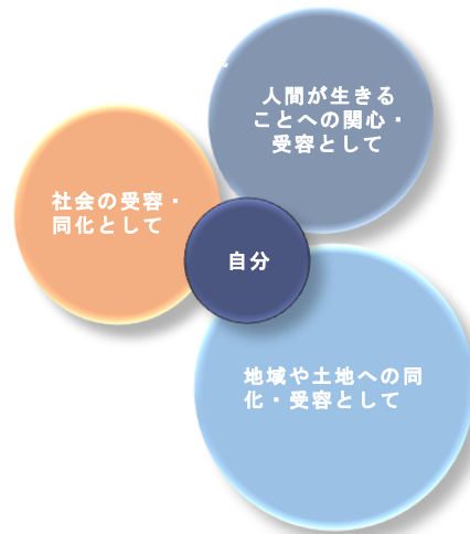
図1 ボランティアへの発動・動機・要因（齊藤 2019）