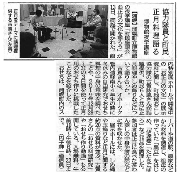
図6 座談会を報じる新聞記事(十勝毎日新聞2022年1月)