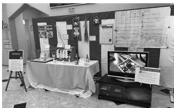
図1 トピック展「お正月の文化展」。浦幌町立博物館

（持田）今日は1月13日なので、お正月的には、お正月っていつまでなのかちょっと私もよく分からないんですけど、1月10日ぐらいまでがだいたい多いですかね。鏡開きとかって。なんですけど、うちはまだお正月の真っ最中でして、〔トピック展〕「お正月の文化展」をやっています（図1）。