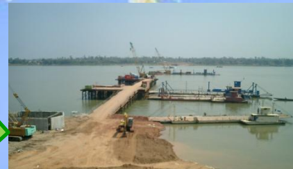
JICAの援助: 第2メコン国際橋