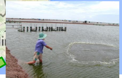
メコンデルタのエビ養殖