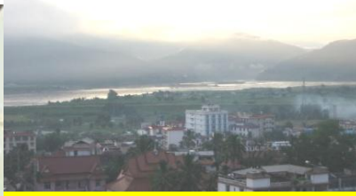
メコン川の夜明け (ビルマ)