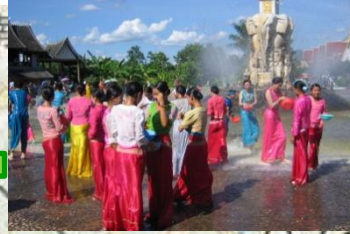
タイ族自治区の水掛け祭り 白河区