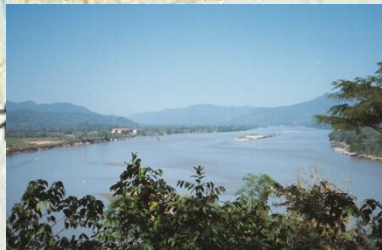
ゴールドトライアングル