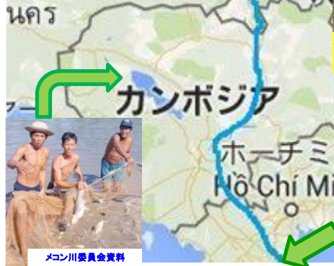
メコン川委員会資料