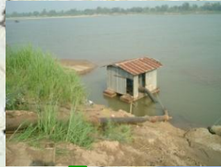
東北タイのポンプ灌漑