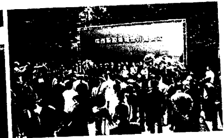
写真2：陝西秦腔博物館開館式 (2009年9月)