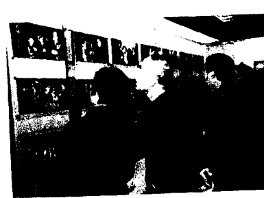
写真1：陝西秦腔博物館を見学する人々 (2009年9月筆者撮影)

このように、近年の秦腔を取り巻く環境は厳しくなっているが、明るい変化の兆しも表れつつある。そのひとつの契機となったのが、秦腔が2006年に「第一回国家級無形文化遺産リスト」に選定され、国家レベルの無形文化遺産に登録されたことである 26 。その背景には、II章で述べた文化政策の大転換があった。そして、こうした無形文化遺産化をきっかけに、秦腔の保護と保存をめぐる動きもさまざまな形で活発化してきている。まず、2009年5月には、秦腔の芸風を後世に伝えるために、政府が流派の伝承人を決めて秦腔の伝承活動を奨励するようになった。実績や芸歴に応じて、秦腔演劇界の11人の名優が伝承人として選ばれ、国からの補助金をもらい、文化を伝承・伝播する法的責任を負って、弟子への教育活動もより積極的に行うようになったのである 27 。これは、政府が秦腔関連の文物だけでなく、伝承人の保護も重視し始めたことを意味する。また、2009年9月には、政府の出資で陝西秦腔博物館が西安で開館した（写真1と2を参照）。この博物館は、秦腔の歴史や芸能の特徴などを幅広く紹介するために、