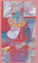
国吉康雄「ミスター・エース」 福武コレクション蔵 (会場にて模写作品を展示)

「海外で高い評価を受けてはいても、故郷の岡山での知名度はそれほどでもない画家・国吉康雄。そんな国吉の作品や最新研究を、多くの人に発信したい」という、市民や学生が企画した体感型アートイベントが「国吉祭」です。2013年から、国吉の故郷、岡山市出石町住民により開催されてきた国吉祭に、2015年から、岡山大学大学院教育学研究科「国吉康雄研究講座」が参加。これまでに、作品展示やアートワークショップなどを、岡山大学、岡山県立大学、岡山市立後楽館高等学校の学生と市民有志、東京からのプロスタッフなど作り上げ、岡山市内を中心に開催してきました。