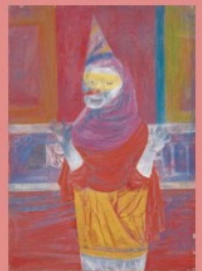
カゼインで描かれた絵画 国吉康雄「舞踏会へ」 福武コレクション蔵

注意点:カゼイン絵具には牛乳成分が含まれています。アレルギーがある方はご遠慮ください。