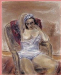
国吉康雄「ものを思う女」 福武コレクション蔵 (会場にて模写作品を展示)

今年の「国吉祭」は、岡山県内各地を巡ります。その名も「国吉祭2018 CARAVAN」。「国吉祭」を開催することで、地域と学生が交流し、互いに新たな発見があることを期待しています。その1回目が行われる高梁市吹屋町は、国吉祭にとって縁ある場所。2016年、この町を代表する広兼邸の修復後の初イベントとして「国吉祭2016」が行われ、好評を博しました。今回は、赤銅色の石州瓦とベンガラ色の外観で統一された美しい町並みで国の重要伝統的建造物群保存地区に認定された「吹屋ふるさと村」が国吉祭の舞台となります。