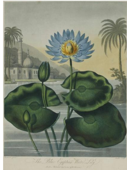
エジプト・スイレン