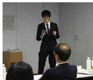
岐阜大生によるビジネスプランコンテスト発表の様子