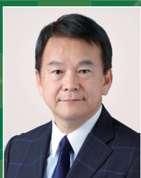
清水 勇人 さいたま市長