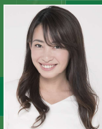
村田 綾 俳優・タレント