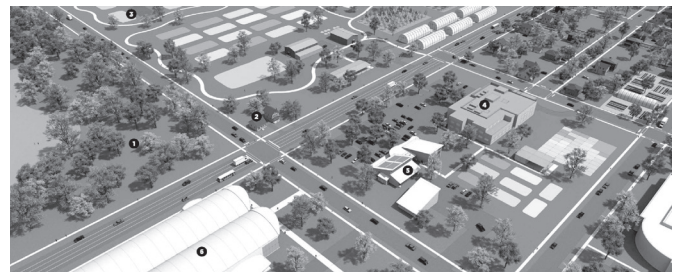
図3 Green Innovation (GI) 地区の空間像 (City of Flint (2013) より引用)

生する Green Neighborhood (GN) 地区と呼ばれる空間像を提示した。深刻な空洞化に直面している住宅地については、ランドバンクが主導し空き地の取得・統合を進めて経済開発用地や大規模都市農業用地等を生み出し土地利用転換を図る Green Innovation (GI) 地区と呼ばれる空間像を提示した。GI 地区は原則的に新規居住者の流入抑制を意図しており(既存の居住者は継続居住が可能である)、総合計画の策定過程における公聴会でも反対意見はなかった。なおGI地区は同市が位置するジェネシー郡のランドバンクであるGCLBA (Genesee County Land Bank Authority) が多くの税滞納物件を保有している。GI地区は原則として経済開発を志向するものの、それが発生しない場合は自然的土地利用へ回帰させることを行政サイドは意図しており、「可変性(flexibility)」を持った土地利用戦略であると言える。