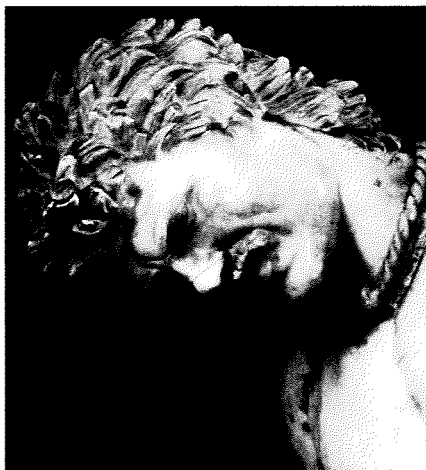
図3 いわゆる《瀕死の剣闘士》部分 Cf. 'that with'ring lip'(LIII)

LIII - LIV : LIII 連全部と、次の LIV 連前半は、1821年版にはなく、1830年版で新たに加筆された部分。すでに1821年版では「《像》=アルミニウス」という等式が成立し、《像》の崇高さがアルミニウスに付与されていたが、1830年版になると、ローマ帝国の支配を甘んじて受けていたゲルマン人アルミニウスの心のなかで恥辱の念が純化されていって、ついに周囲の自然がアルミニウスの魂に対して、恥辱の念を叫びかけるに及んで、全身に炎が燃え立ち、アルミニウスが本能的に剣を抜き、ウァールスの軍団に攻撃をしかけた、という心の動きが描かれている。