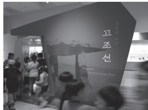
写真5 古朝鮮展示室

も同様で、木浦市立自然史博物館（図1-10）を訪れた際には「独島の海洋生物」という特別展が開催されていた。懸念されるのは領土問題の時間的深度が無制限に深くなり、ついには先史文化にまで及ぶことであるが、現在のところは、あくまで笑い話として竹島／独島問題の解決には櫛目土器（韓半島新石器時代を特徴づける土器）を竹島／独島に撒けばいい、という話がなされる程度にとどまっている 7 。