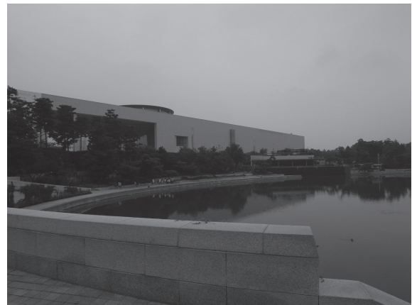
写真4 国立中央博物館

また、国立中央博物館がリニューアル開館した年の特別展が、韓国で言うところの独島（日本で言うところの島根県竹島）であったのも著名である。こうした面が顕著になるのは人文・歴史系だけでなく、自然系