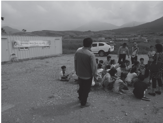
写真3 和山遺跡見学会

されるのは、「調査報告書を2年以内に文化財庁長に提出すること」という「埋蔵文化財保護及び調査に関する法令」 4 の第15条の厳格適用がなされていることである。報告書が期限内に刊行できなかった場合、調査事業の入札において著しく不利に働き、発掘許可が下りないこともある。「2年以内というのは発掘調査終了日から数えて2年以内」で、センターの調査員は野外調査と、かつて発掘調査をおこなった遺跡の報告書作成を掛け持ちしている状態であった。韓国の調査員からは「日本の報告書は分析をしっかりとってから刊行されるが、私たちは2年という短い期間で刊行しなければならない」ということを嘆いていたが、一方で予算化のタイミングを逃すと著しく刊行が遅れたり、未刊行のままになっている日本の遺跡の事例を知る身としては複雑な心境だった。発掘調査から報告書刊行までが一連の事業と意識せざるをえない仕組みになっているのは、韓国の制度の評価すべき点であるかもしれないが、報告書の質については韓国の研究者も問題視している。今でも同第2項によって、長期間の研究を要する遺跡等は2年以上の報告書作成期間が許可されているということだが、常に適正なバランスの模索が求められるだろう。