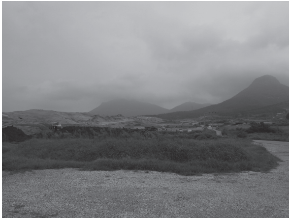
写真2 和山遺跡遠景

原因者の負担という、日本と同様の方式がとられている。発掘調査はすべからく学術的であるべきという立場からは、「救済発掘」という言葉自体に、発掘調査とその対象となる遺跡のランク付けを追認するはたらきがあることを問題視する意見もある。この辺りの事情は、同じく大規模土木工事に伴う記録・保存のための発掘調査である「行政発掘」に対する複雑な感情や疑問の声が絶えなかった日本と同様である。行政発掘／救済発掘は予算規模の大きさから広大な範囲を一度に調査することも多く、そうした調査ならではの情報が得られることも多い。長興郡和山遺跡はそうした例に含まれる。