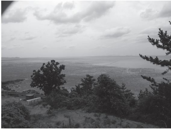
写真7 白岫海岸干潟

広がる耕作地での農作業の合間に休憩をする人々がいたり、公園周辺では民家近くの甕置き場内にあることから「甕置き場支石墓」とガイドブックに紹介されている支石墓の周りにも既に民家も甕置き場もなかったり（写真6）、と様々な史跡化に伴う Narrative が生成されていることと思われる。そうしたものに目を向け、掬い上げることも今後の史跡マネジメントには重要な要素と考えられるが、以下ではそこまでミクロでもなく、かといってマクロでもない中間レイヤーに焦点をしばって考察を進めたい。