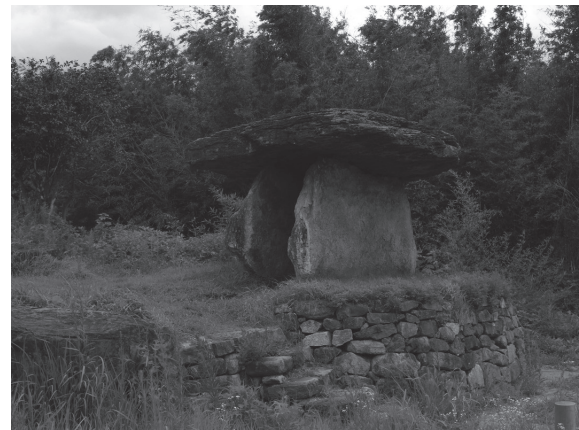
写真 6 元・甕置き場支石墓

Master Narrative という面では、日本では特に第二次世界大戦後、日本列島という現在の国土の領域内で、文化や国民性の同一性を際限なく遡らせる特徴が指摘されているが 8 、韓国では前章での博物館展示の特徴が示すように、過去にあり得た／未来にあり得る領域